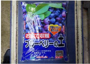
ブルーベリーの土