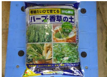
ハーブ・香草の土