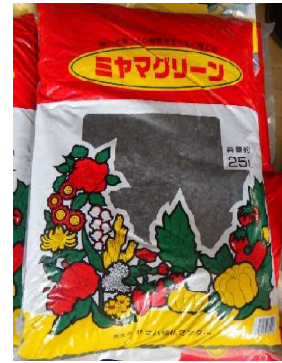
化成肥料:ミヤマクリーン