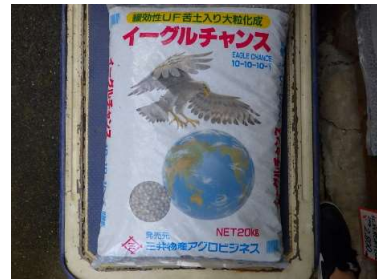
化成肥料:イーグルチャンス