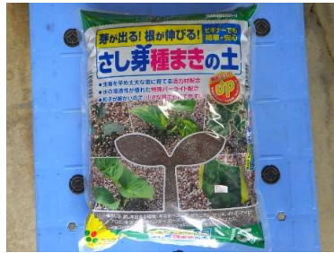
さし芽種まきの土