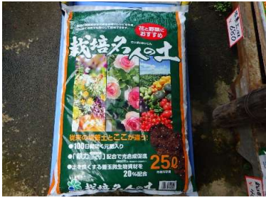
培養土:栽培名人の土