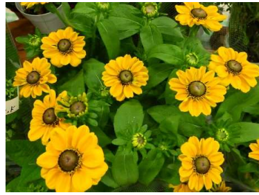
ルドベキア トゴールド