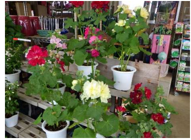
タチアオイ スプリング