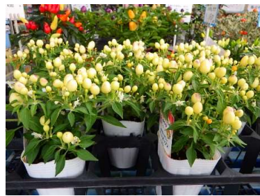
五色トウガラシ 観賞用